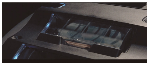
ВОЗМОЖНОСТЬ ОТМЕРЫ ОПЕРАЦИИ ДЕПОНИРОВАНИЯ И БЫСТРОГО ВОЗВРАТА ПРИНЯТЫХ БАНКНОТ С ИСПОЛЬЗОВАНИЕМ БАРАБАНА ВРЕМЕННОГО ХРАНЕНИЯ БАНКНОТ (ESCROW)